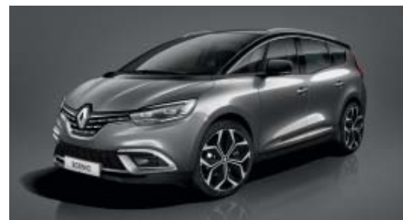
Gris Cassiopée (OV)