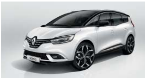
Blanc Glacier (OV)