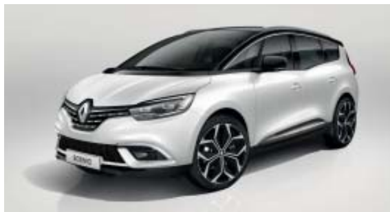
Blanc Nacré (PM)