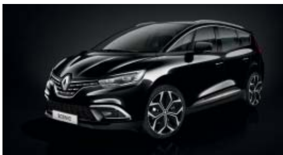
Noir Étoilé (PM)