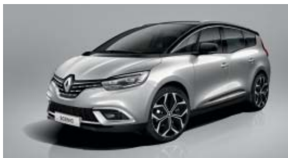
Gris Platine (PM)