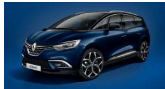
Bleu Cosmos (PM)