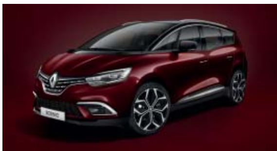
Rouge Millésime (PM)

OV : opaque vernis. PM : peinture métallisée. photos non contractuelles.